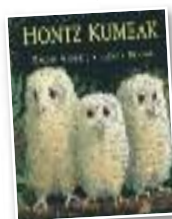
Haur liburua "Hontz kumeak"