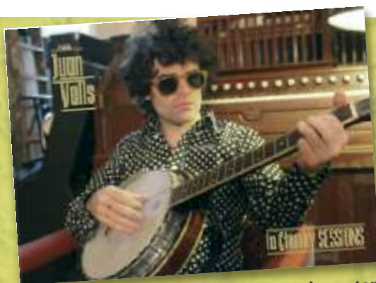
Txaketua, Pako eta Boga tabernetan eskura daiteke diskoa 5 €-tan

» Azaroaren 19an emango du aurkezpen kontzertua Patrua Kalen (19:45)