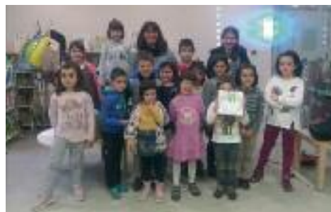
Lehen ipuinean parte hartu zuen ume taldea

Herriko umeen artean bigarren ipuin ibiltaria idazteko ekimena jarriko du abian udal liburutegiak. Koaderno batean idazten joango dira ipuina; haur edo haur talde bakoitzak orrialde bat, aurretik idatzitakoari jarraipena emanez. Ume edo talde bakoitzak astebete izango du idazteko. Parte hartu nahi duenak Haur liburutegian eman behar du izena azaroan zehar. Gehienez 15 ume onartuko dira.