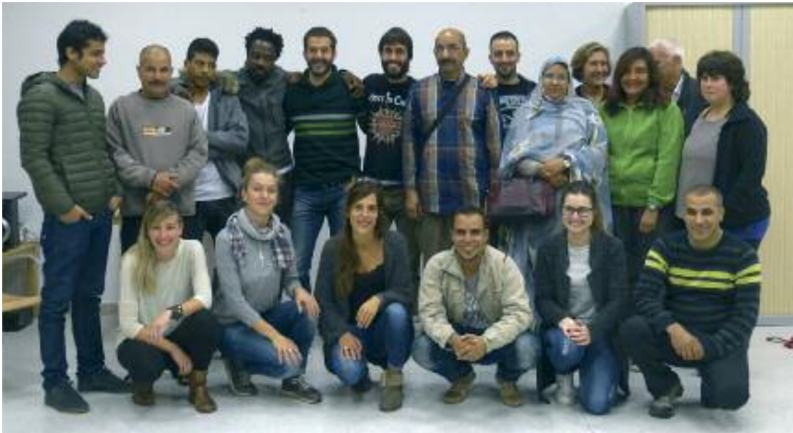
Auzoko-n parte hartzen duten zenbait lagun eta udal ordezkariak, ikasturte berriaren hasiera ekitaldian