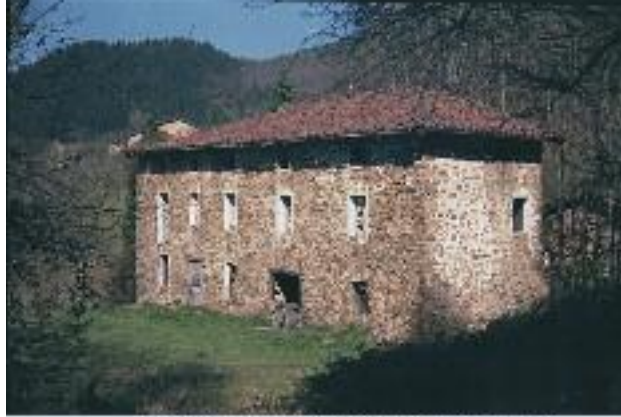
Intxola 1969 (desagertuta) - Olibarrieta Auzoa (Argaiñola José Urtebe)

Auzotar maittiok, ermita eder honetan alkartu gara gaiñian dogun Aste Santua bihar dan moduan gertaketa-ko. Garizuman gagoz, gure gorpu-tzak eta animak garbiketako garaixa; horregatik, bada, lehenengo eta behin aitortu degigun gure pekatuak. Isilunia egin eta gero... San Jose be hor dogu