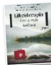
Liburua "Libroterapia. Leer es vida"