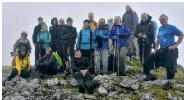
Azaroko irteeran Hirumugarrietan ateratako argazkia

Aloña Mendik hile honetarako antolatu duen irteera Valderejoko natur parkean barrena izango da, San Lorenzoko ermita bisitatuz eta Purón ibaiaren bideari jarraituz. Guztira 16 km. eta 700 m-ko desnibela, zailtasun barik. Irteera, goizeko 8etan, postetxean. Izena emateko azken eguna: azaroak 16, Aloña Mendi tabernan edo alonomendi.mendi@gmail.com helbidean.