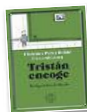
Haur liburua "Tristán encoge"