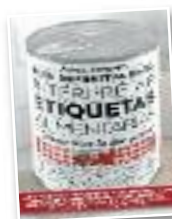
Liburua "Conoce bien lo que comes"