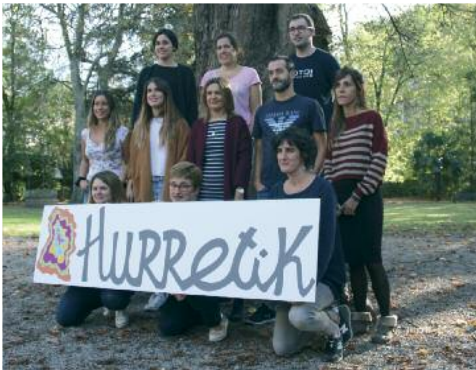
Udaleko Hezkuntza saila, herriko hiru ikastetxeak eta Euskaltzaleen Topagunea ari dira, elkarlanean, proiektua gidatzen

‘Hurretik ikasmateriala’ren bitartez Oñatiko ondarea ikastetxeetako geletara eramango da ariketa, proiektu, lan... eta abarren bitartez. 2.018ko irailerako ikastetxeen eskura jarriko da LH1 eta LH2 mailetan lantzeko zortzi sekuentzia didaktikoz osatutako materiala, gaur arte Turismo Bulegoak eta Natur Eskolak egiten duten lanaren osagarri izan nahi duena, ez bait gara zerotik abiatzen. Ikasmaterial honek WEBGUNE-BLOG itxura hartuko du eta HURRETIK sarean egongo da nahi duenak eskura izan dezan. Hau da, ikastetxeek ez ezik, nahi duen herritar orok izango du bertara sarbidea.